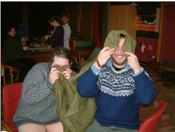
Ny dansk oppfinnelse?

Vi hadde bestemt oss for å lage et nytt og bedre toppsegl og ny råduk til storseglet. Først må vi finne ut hvor stort seglet skal være, så må det tegnes opp hvor stor duk som skal klippes, hvor stort seglet skal være med fall el. innbrett. Hjuling el. innsving/oppsving må regnes ut og hvor mye skyting det skal være hvor. Vanskelig å forstå? Enig. Vi brukte litt tid på dette før vi kom ordentlig i gang, men med en tålmodig kursleder og ivrige deltagere gikk det etter hvert bra.