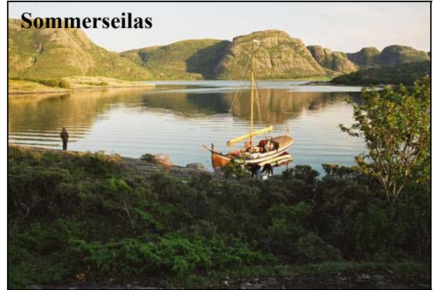
Selnesvågen i Åfjord.

Det er ikke satt opp noe spesielt mål for årets seilas ennå, men det er nevnt at det kunne være fint for flere å få prøvd seg på en havseilas. Kanskje sørover langs kysten til en avveksling, stikke et døgn ut til havs for så å vende tilbake igjen lenger sør et sted? Christine har meldt seg som koordinator for årets seilas, så ta kontakt med henne (se nedenfor) dersom du ønsker å være med. Opplegg for årets sommerseilas vil også bli nærmere diskutert i utsetthelga på Stadsbygd.