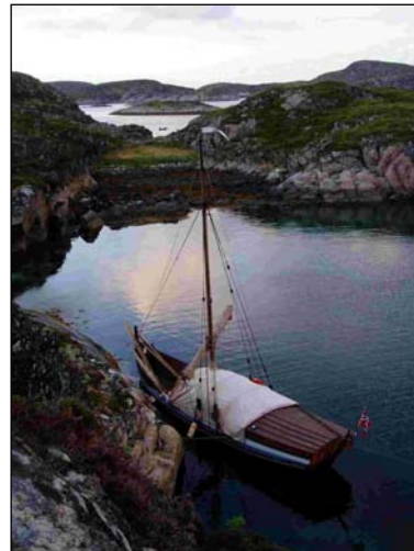
Naturhavn ved Ellingråsa

Spaknende vind, men lettere vær. Motoren fikk gå, og vi mange fine idyller i Flatangers skjærgård så. Ved en grunne rett vest av Kvaløya fisket vi dagens makrell-middag. Fin-navigering fikk vi praktisert gjennom Småværet før vi fant en enda finere naturhavn inne i Nesvågen, like nord for Buholmråsa fyr.