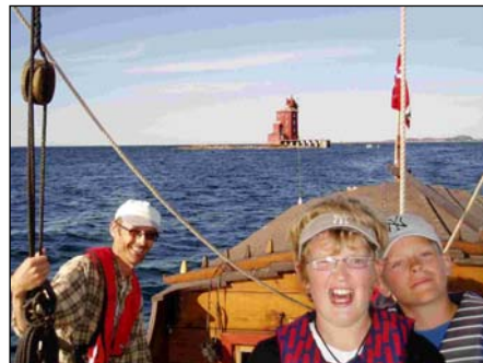
Happy boys passerer Kjeungskjæret.