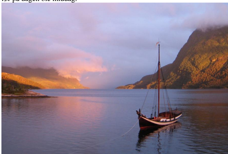
nidaros for anker i solnedgang

Her var det flott. Med et lavt skydekke og en sommersonne som gløtte gjennom fra havet, ble Nidaros liggende for anker ute i vika ved hytta. Her tittet vi litt på de lokale geitbåtene i naustet, og småfiskene som ble fisket ved bryggekannten før på dagen ble middag.