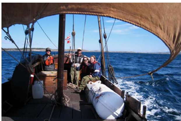
fornøyde seilere i medvind

imponerende elegant inn i havna. Og med den mest spennende skuta stod småungene på land og ropte: "Der er kaptein Sabeltann"!