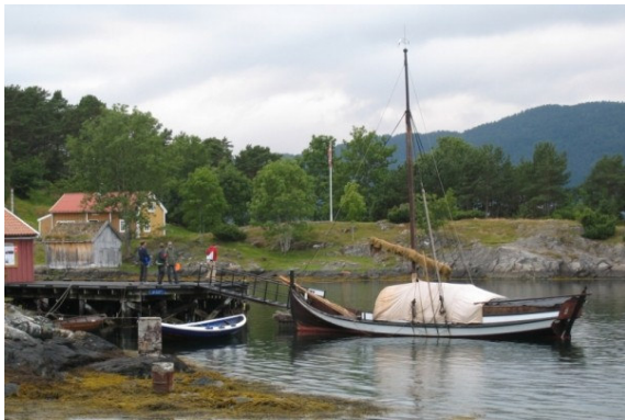
Hjertøya ved Molde

Søndagen opprant og det var ennå oppholdsvær. Lekkasjen framme i båten var tydeligvis ennå ikke fikset, og pumpa hadde vekt høvedsmannen ca. hver time, så mye nattesøvn ble det ikke den første natta. Vi prøvde å tette lekkasjen med både smør, tjærevoks og mauring før vi kastet loss og la oss på kryss ut Moldefjorden. Lite vind, motstrøm og kort avstand mellom skjærene bidro til at vi tok ned seilene og kjørte motor til vi passerte enden på Hjertøya. Her prøvde vi igjen å krysse oss utover. Ut Julsundet kom det litt vind, men den ga seg like fort som den kom, så før vi kom til Tautra ble motoren startet igjen og vi tøffet av gårde til Lauvøya inne i Vatnefjorden for å finne havn for natta.