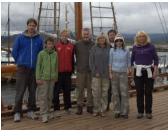
Mannskap første uka

Torsdag – nå skulle vi over Hustadvika og det gikk rimelig greit i stille og grått vær. Sola kom fram de siste milene mot Bjørnsund og da kom vinden også. Vi bevilget oss en ekstrarunde utpå der men så var det nok og havna venta. Gjestebryggene var for skrælinger så med fulle lanterner elget vi oss heller inn på kaia til leirskolen. Og som vanlig fikk vi tilgivelse læll og alle var snille – ja spesielt snille med måsene.