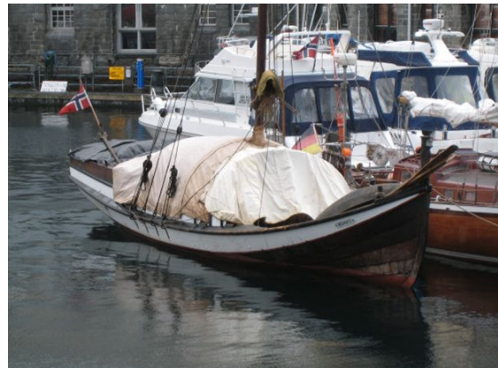
Værfast i Ålesund