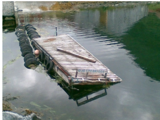
Praktisk gjestebrygge i Brandal

bygevær og lavt skydekke langs Sula-landet, rundet Eltranaset med god margin og dreide inn mot Brandal. Her hadde vi tenkt å rekke Ishavsmuseet, men det var nok stengt når vi ankom. Gjestebrygga var havarert, men ville nok heller ikke hatt plass til oss, så det ble å legge seg på enden av den private flytebrygga. Stedet virket helt utdødd, men vi så tegn til liv.