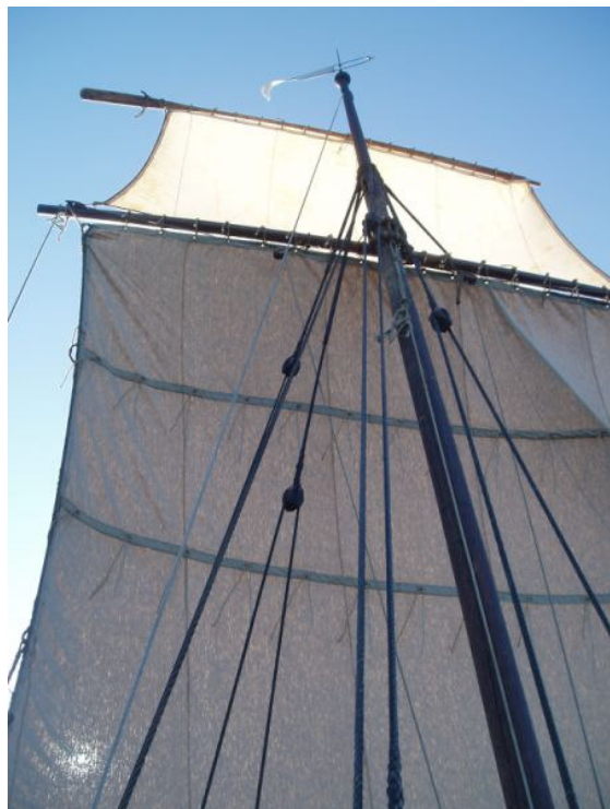
Nysegel med åre som toppseglrå

Det nye seglet ble ferdig til sommeren 2008, men ikke tatt med på sommerseilasen. Det ble derimot flittig brukt i høst på onsdagsseilasene og ser ut til å fungere bra.