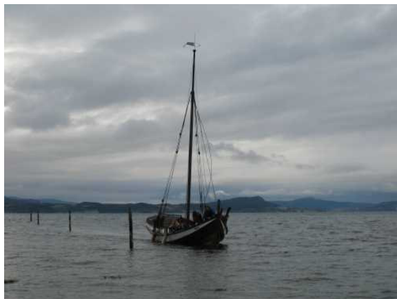
På vei inn til oppsett på Kystens Arv

Båten ble satt på land den 4. oktober i fjor ved hjelp av 10-12 ivrige medlemmer og en enda ivrigere traktor.