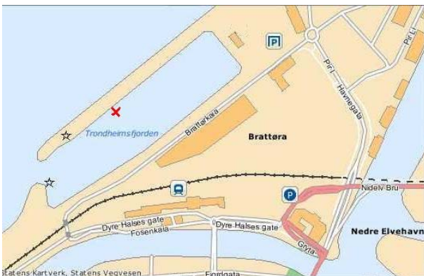
Trondheimsfjorden er nok litt større enn hva kartet antyder ☺

Den vil ligge på molosiden i Brattørbassenget. Om man kommer fra byen eller Fosenkaia så passerer en Pirterminalen og fortsetter ut på moloen (rødt kryss på kartet).